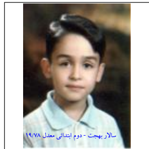
سالاردهج - دوم ابتدایی معدل ۱۹/۹۸