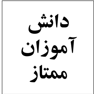
مهروزه موسوی نسی - دوم ابتدایی معدل ۱۹/۸۱