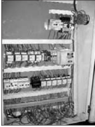
عکس روز ۵۵

دلایل انتخاب پروژه برای بهبود: ۱- قرار گرفتن تابلوی برق در زیر دستگاه در مسیر تخلیه خاک کنت و نفوذ آب و صابون به داخل آن باعث بوجود آمدن اشکالات عدیده‌ای می‌شد. ۲- جاسازی نامناسب تابلو باعث طولانی شدن زمان تعمیر. ۳- قدیمی بودن و فرسوده شدن قطعات برق این دو دستگاه باعث طولانی شدن زمان تعمیر و نیز هزینه بیشتر برای خرید آنها (بدلیل کمیاب بودن).