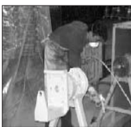
عکس روز ۵۵

۴- پایین بودن سیستم ایمنی موتورهای الکتریکی ۵- مسیر برق ورودی به دستگاه از ایمنی خیلی پائینی برخوردار بود. ۶- کلید سه فاز ورودی به کلی ازین رفته و اتصال کوتاه شده بود. تیم کایزن تعمیرات برق چرخنده سازی با شناسایی و حل موداهای یاد شده، اقدام به طراحی و نصب تابلوی برق جدید برای این دو دستگاه نمودند. که دارای مزایایی همچون ۱۰- تمامی یوزها به صورت بی مثال انتخاب شده که در صورت اشکال، جریان قطع می‌شود ولی از بین نروند. ۲۰- تمامی قطعات استفاده شده در بازار به وفور یافت می‌شود ۳- عدم خرابی موتورها بدلیل بالا بردن سیستم ایمنی موتورها ۴- بالا بردن سیستم ایمنی برق ورودی ۵- پایین آمدن زمان تعمیرکاری؛ می‌باشند.