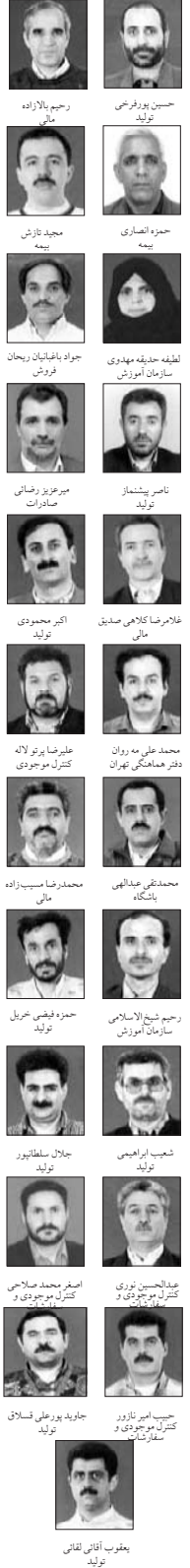
با سلام حضور خوندگان محترم این صفحه و علاقه مندان به نظام پیشنهادها: